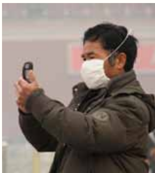
Pekingbo modell vårvintern 2013.

Genomsnittliga värden på över 25 mikrogram PM2.5 per kubikmeter luft över en 24-timmarsperiod är en risk för hälsan, enligt världshälsorganisationen WHO. Under den gångna vintern har Peking upplevt dygn med 40 gånger detta gränsvärde.