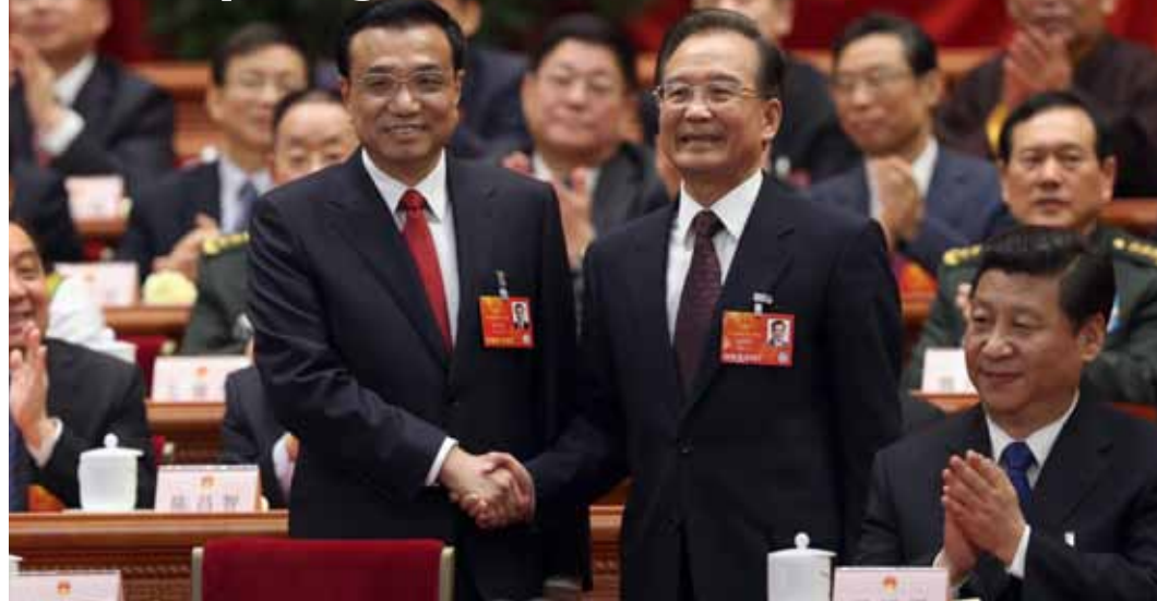
Nye premiärminister Li Keqiang till vänster skakar hand med avgående Wen Jiabao. Till höger sitter president Xi Jinping.

NYE PREMIÄRMINISTERN LI KEQIANG skiljer sig på ett intressant sätt från de andra medlemmarna i partiets innersta makt-kärna. Han kommer från enkla omständigheter, medan nästa samtliga av de övriga sex hör till